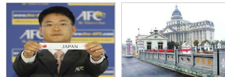
伦敦奥运亚洲区足球预选赛 抽签揭晓 中国战阿曼 阜阳“白宫书记”判死缓 为换风水改门