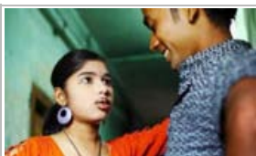
孟加拉的性工作者【高清】