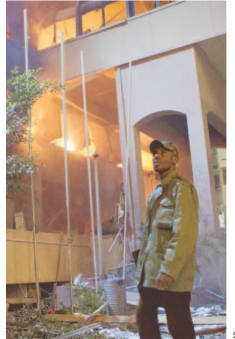
BOMBARDEO El edificio de servicios de seguridad fue destruido.

Por otra parte, nuevos bombardeos de la Otan dejaron en llamas durante horas la sede de los servicios de seguridad interior y el ministerio de Inspección y Con-