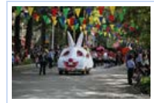
威廉 子 婚 月