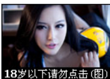
18岁以下请勿点击(图)