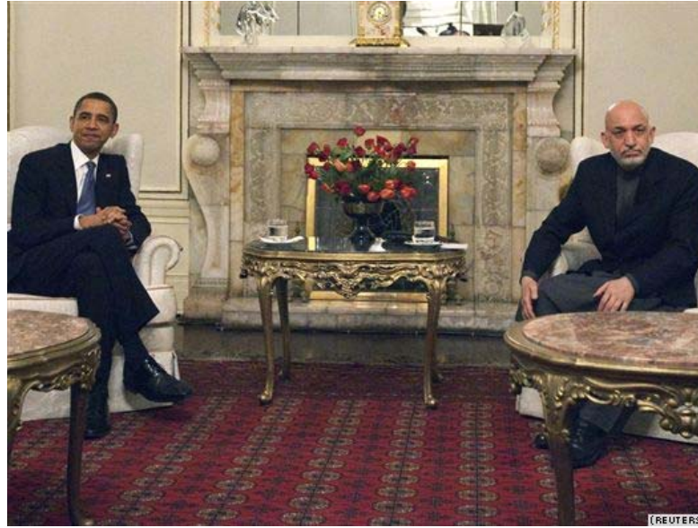
Барак Обама и Хамид Карзай