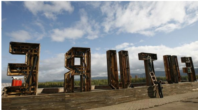
- Installation de «Future», une oeuvre de l'artiste Andrei Roiter à Krasnoïarsk en Sibérie, en septembre 2011. -

L'influence des think tank se mesure-t-elle au nombre de «likes» sur Facebook?