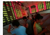
大陆股市九月蒸发3万亿 “世上最大万人坑”