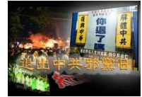
“十一”国殇日一亿三退大潮 全球去共化