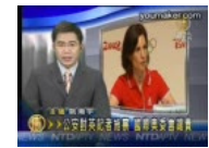
公安对英记者施暴 国际