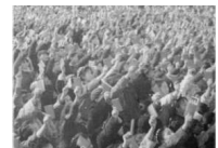
“我是杀人犯”央视拒绝红卫兵忏悔