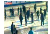
大陆劳工遭俄罗斯特警

北美新闻最新文章 北美新闻排行榜 现金短缺 美政府拟出售资产 美职场古怪雇人术 面试问题无厘头 奥菲利亚飓风扑加 威力减弱 门口歧视黑人刻字 裴利惹争议 逮捕没在怕 反华尔街示威持续 纽约侨界升旗 庆祝中华民国建国百年 旧金山市长挂红旗引争议 美前议长:最 阿拉斯加选民要决定要鲑鱼还是要黄金 高盛:美国可能免于经济衰退 美国华尔街抗议行动蔓延到西部大城 大陆楼市遇“滑铁卢” 京沪穗深销售惨 美首例经济谍案维持原判 钟东藩充当中 飞康国际华裔创办人胡艾瑞征饮弹自杀 旧金山市长挂红旗引争议 美前议长:最 加官员陈国治被曝喜悦中领馆 阻大纪元 “占领华尔街” 愈演愈烈 700多人被捕 谷歌为美国住家提供太阳能系统 只需绑 黑莓平板电脑美加降价 最低价249元 疫情扩大 美16人死 华人防哈密瓜 加前议员曝调查中共间谍渗透的内幕