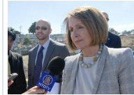
旧金山市长挂红旗引争议 美前议长:最关注中