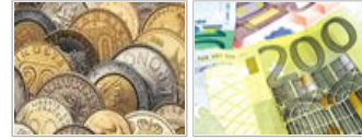
零售业进入政策黄金