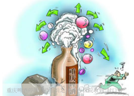
重庆啤酒停售 刀客兵之 号医院收到“封口信”