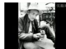
他感动了中国却没有感动CCTV