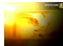
新闻聊天室：法学教授标价64万卖身缘由