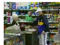
重听阿婆卖东西整客人