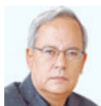
César Hildebrandt Columnista