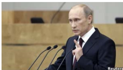
Нынешнее выступление Владимира Путина многие эксперты называют предвыборным

Россия к 2020 году должна войти в пятерку крупнейших экономик мира и догнать по уровню ВВП европейские страны, заявил российский премьер Владимир Путин, выступая в Госдуме с отчетом о работе правительства.