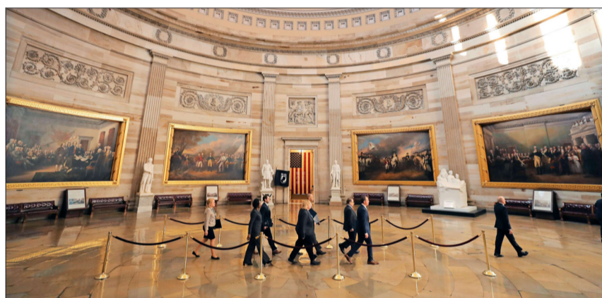
LOS FISCALES del proceso liderados por Schiff cruzan hacia el Senado, donde tendrán unas 24 horas para exponer los argumentos iniciales si se replica el modelo del juicio a Clinton.