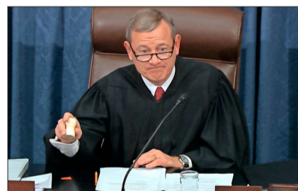
EL PRESIDENTE de la Corte Suprema, John Roberts, liderará las sesiones del juicio.

En el Senado ahora, estará frente a las profundas divisiones partidistas, con los ojos del país sobre lo que ocurre en el proceso que evaluará la destitución del Presidente. "Los jueces son servidores de la ley, no al revés. Los jueces son como árbitros. Los árbitros no hacen las reglas, las aplican", dijo en 2005 en el Senado en su proceso de confirmación en el cargo. Por eso es que probablemente intentará ser invisible en el juicio a Trump y minimizar lo más posible su papel.