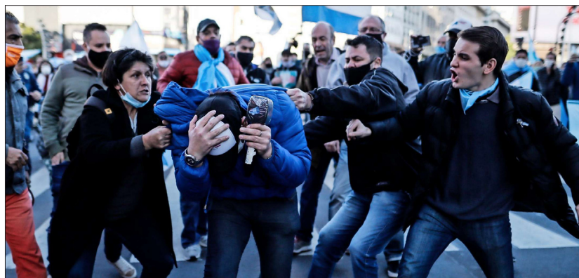
UN PERIODISTA del canal C5N fue agredido durante las protestas en el Obelisco.