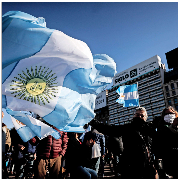
BUENOS AIRES tuvo una de las mayores convocatorias.

En el día del aniversario patrio de Argentina, miles de personas protestaron ayer en Buenos Aires, Córdoba, Mendoza y otras ciudades contra el proyecto de expropiación de la agroexportadora Vicentin que planea el gobierno y de la estrategia ante la pandemia.