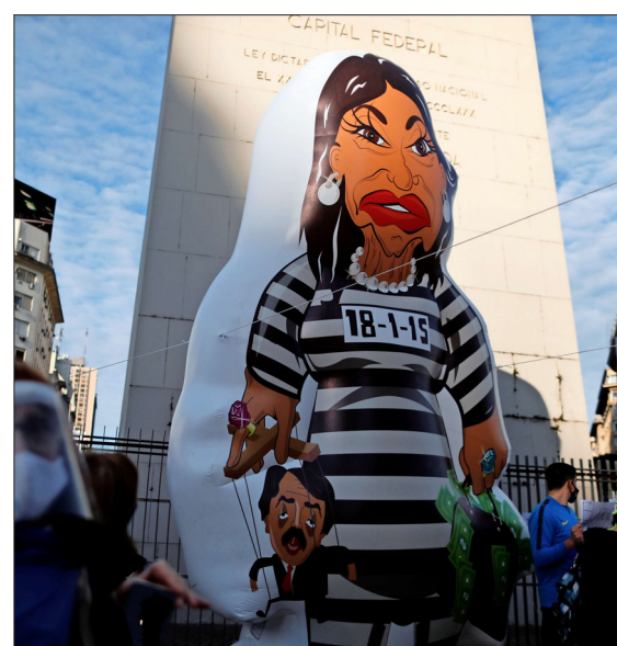
ALGUNOS MANIFESTANTES llevaron globos con caricaturas de la vicepresidenta Cristina Fernández. En la parte de abajo se ve un dibujo del Presidente.

Estados Unidos: George Floyd repitió 20 veces que no podía respirar