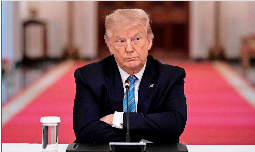
DONALD TRUMP afirmó ayer que es víctima de una “cacería de brujas”, como lo ha hecho en otras ocasiones.

En esa resolución, el tribunal recordó que el Presidente no está “por encima del deber común de presentar pruebas cuando se le solicitan en un proceso penal” e indicó que la empresa de contabilidad con la que trabajó