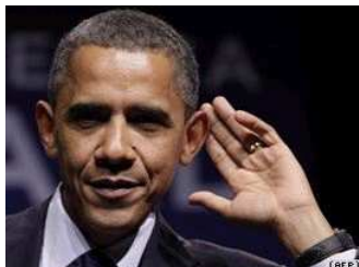
Президент США Барак Обама