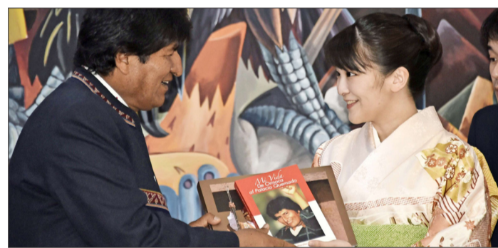
EVO MORALES regaló una biografía suya a la princesa Mako, de 28 años.