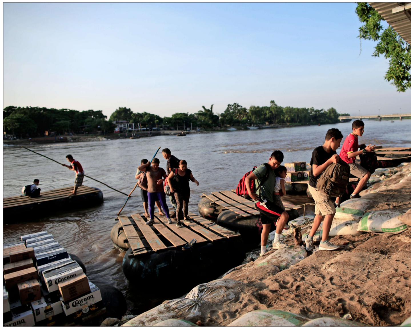
MIGRANTES GUATEMALTECOS llegan en balsas hasta Ciudad Hidalgo, México. Se espera que aumenten los cruces ilegales debido a las nuevas medidas.

La legislación nacional permite a los solicitantes de asilo hacerlo al llegar a la frontera sin considerar su ruta, pero cuenta con una excepción para aquellos que lo hacen a través de un tercer país considerado "seguro". En la actualidad, sin