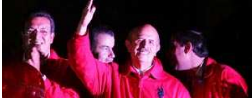
• Fausto Vallejo recibe constancia como gobernador electo