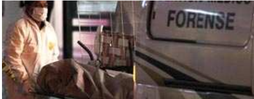
• Soldados abaten a tres durante enfrentamiento en Pesquería, NL