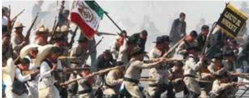
• Calderón dice no a narcoelección en el marco del 101 aniversario de la Revolución