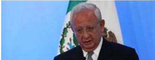
• Convoca Silva Meza a mantener la paz sin caos