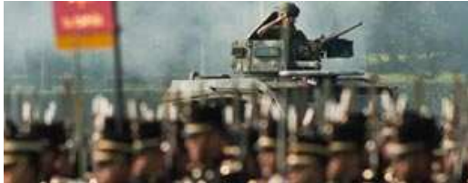
• Fuerzas Armadas refrendan su unión contra el crimen