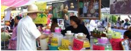
• El pulque no ha perdido la batalla por la sobrevivencia