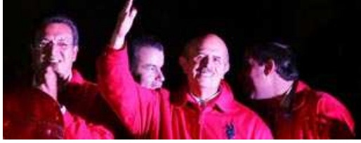
• Fausto Vallejo recibe constancia como gobernador electo