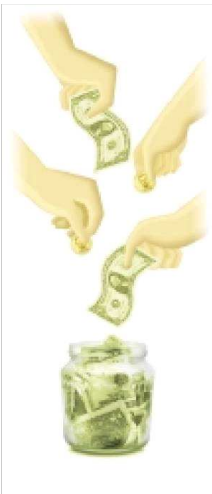
Ilustración de La Prensa/Giancarlo Gil