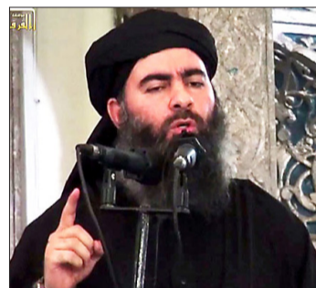
EN EL VIDEO se identifica a Al Bagdadi como el “califa Ibrahim”.

En su sermón, Al Bagdadi instó a sus seguidores a que le obedezcan si él obedece a Dios, y a continuar el camino de la Jihad porque es “la vía del orgullo”. “Soy el wali (líder) designado para dirigirlos, pero no soy mejor que ustedes. Si piensan que tengo razón, ayúdennme. Si creen que estoy equivocado, aconséjenme”, dijo.