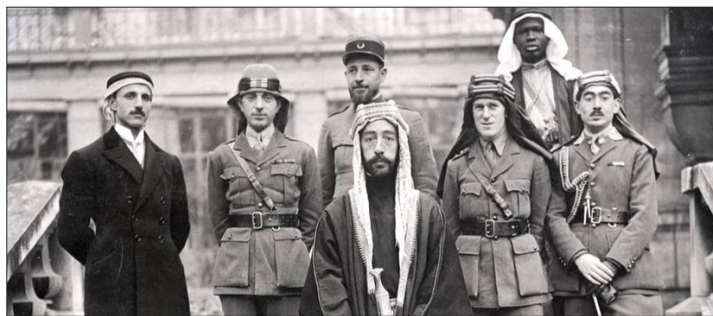
EN LA CONFERENCIA DE VERSALLES nació el actual Irak. En la foto se ve al príncipe Faisal (al centro) junto al coronel T. H. Lawrence, el famoso “Lawrence de Arabia” (segundo de derecha a izquierda).

Solo en 1932 Irak pasaría a ser una monarquía constitucional, la cual desapareció tras el golpe de Estado militar de 1958, cuando Faisal II fue ejecutado junto a toda su familia.