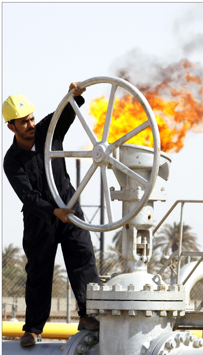
CON RESERVAS de 141 mil millones de barriles, Irak es el quinto país más importante en esta categoría. En la foto, la refinera de Nahran Omar.

Una riqueza que al mismo tiempo parece una maldición, ya que representa el principal botón de la lucha sectaria que vive el país y que las grandes potencias occidentales han buscado controlar durante décadas.