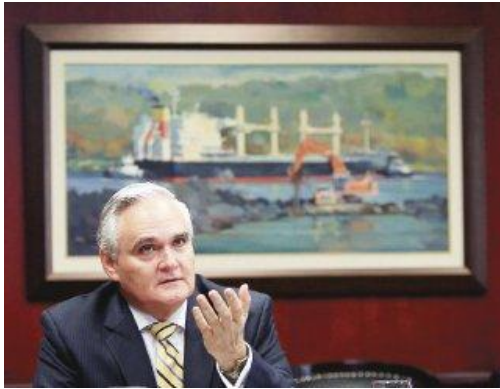
Pie de foto LA PRENSA/Credito

ÁLVARO SANTANA alvaro.santana@prensa.com