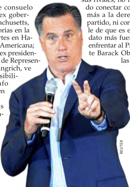
ROMNEY pasará dos días en Nueva York recolectando fondos.

En la búsqueda de todos los votos posibles, Santorum llegó ayer a Puerto Rico para intentar quedarse con los 23 delegados que se disputarán ahí este domingo. La próxima semana tendrá un duro apronte en Illinois, el estado de Obama.