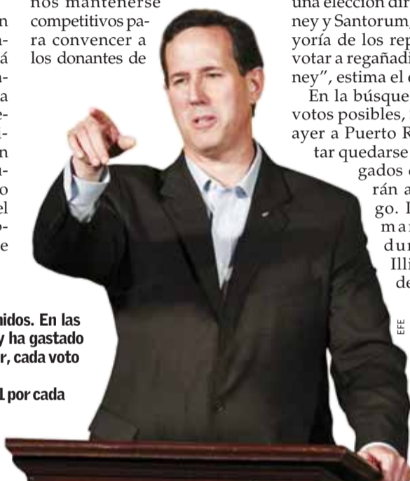
SANTORUM llegó ayer a Puerto Rico a hacer campaña para las primarias del domingo.