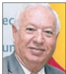
José M. García-Margallo MINISTRO DE ASUNTOS EXTERIORES