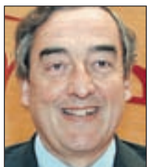
Juan Rosell PRESIDENTE DE LA CEOE