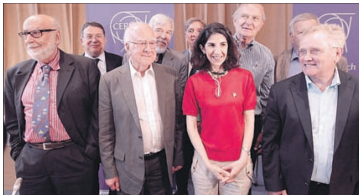
HALLAN LA PARTÍCULA QUE EXPLICA POR QUÉ EXISTE LA MATERIA. El CERN ha descubierto una nueva partícula subatómica que podría ser el bosón de Higgs, también llamado "partícula de Dios". Se la denomina así porque es la responsable de que el Universo se haya coagulado y de que todas las demás partículas no viajen por el cosmos a la velocidad de la luz. El avance marca un hito histórico que nos acerca al origen de la materia.