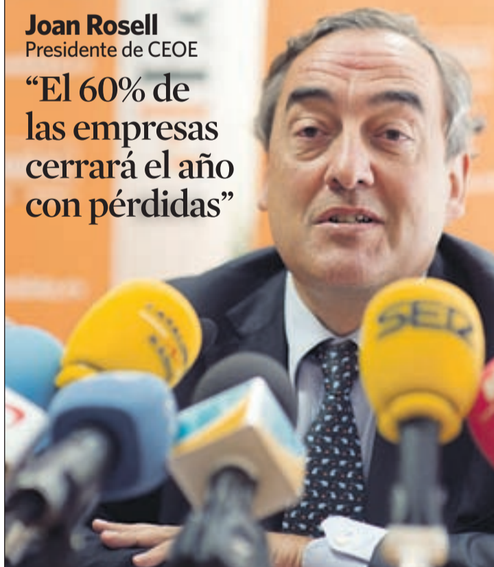
El presidente de la CEOE, Joan Rosell.

"El 60% de las empresas cerrará el año con pérdidas"