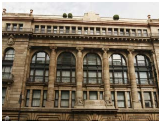
La economía de México crecerá entre 3.2 y 4.2 por ciento en 2011.

Sánchez no hizo comentarios sobre política monetaria directamente. El banco central mexicano ha