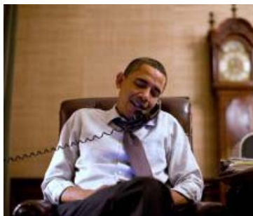
El presidente Obama llama al representante republicano John Boehner en la noche de las elecciones.

WASHINGTON, D.C. - Más allá de sus índices semanales de aprobación, el Presidente Barack Obama recibió ayer -por primera vez-, el pulso público sobre su liderazgo, a través las urnas. Un mensaje estremecedor y cargado de preocupación.