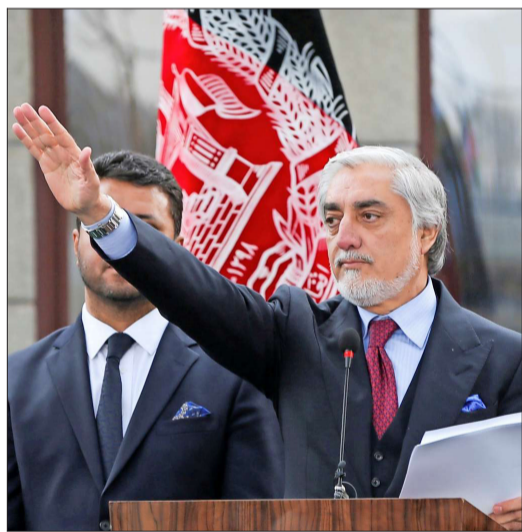
ABDULÁ acusó de fraude a las últimas elecciones.