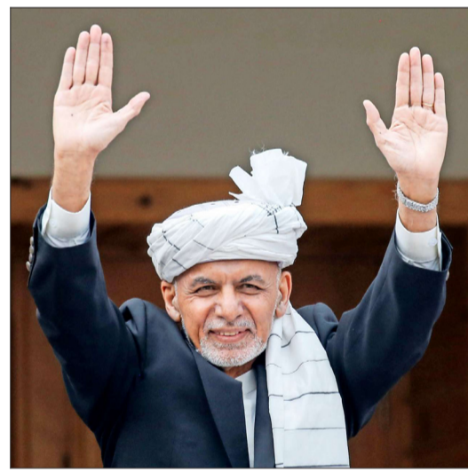
ASHRAF GHANI es el actual Presidente del país.